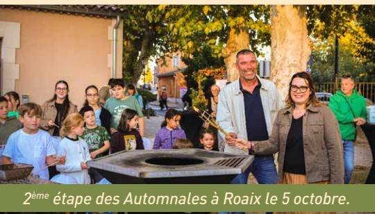
2 ème étape des Automnales à Roaix le 5 octobre.