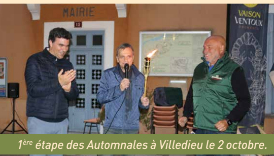
1 ère étape des Automnales à Villedieu le 2 octobre.

Retrouvez les détails mis à jour pour chaque manifestation sur le site de l'Office de tourisme : vaison-ventoux-provence.com