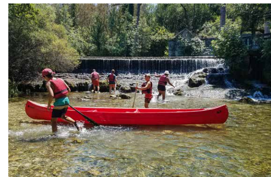
Cet été, plusieurs séjours étaient proposés aux ados.