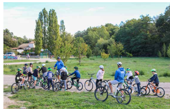
L'un des cycles proposés par l'école multisports : le vélo/VTT.