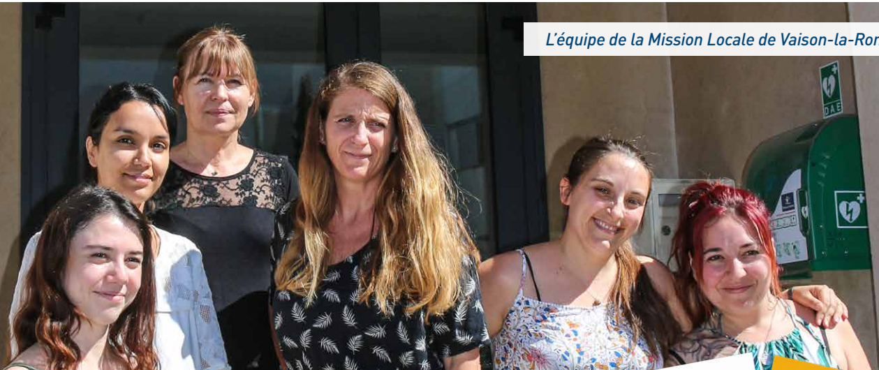
L'équipe de la Mission Locale de Vaison-la-Romaine.

La Mission Locale du Haut Vaucluse intervient auprès des jeunes pour faciliter leur insertion professionnelle et sociale. L'une de ses antennes est basée à Vaison-la-Romaine. Parmi toutes les aides proposées, le Contrat d'Engagement Jeune (CEJ) est un nouveau dispositif pour favoriser l'accès à l'emploi des jeunes.